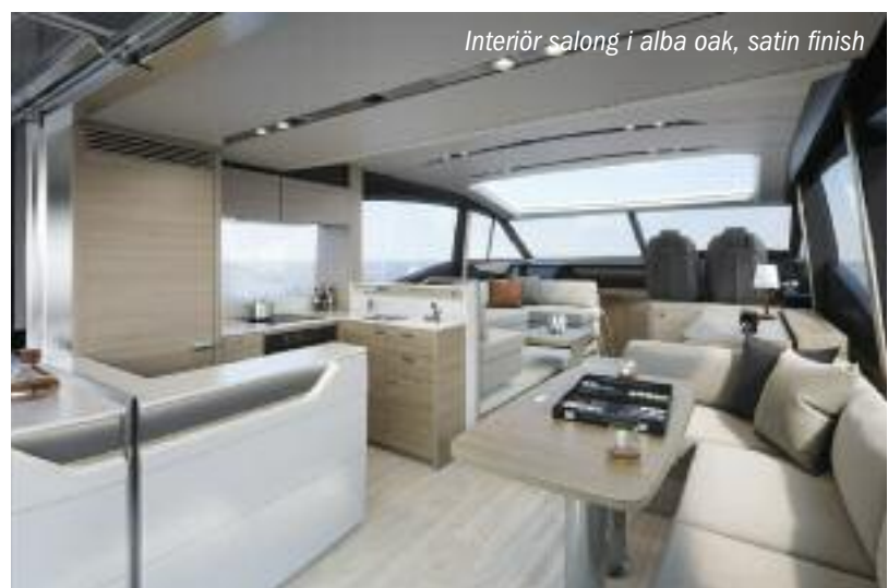
Interiör salong i alba oak, satin finish