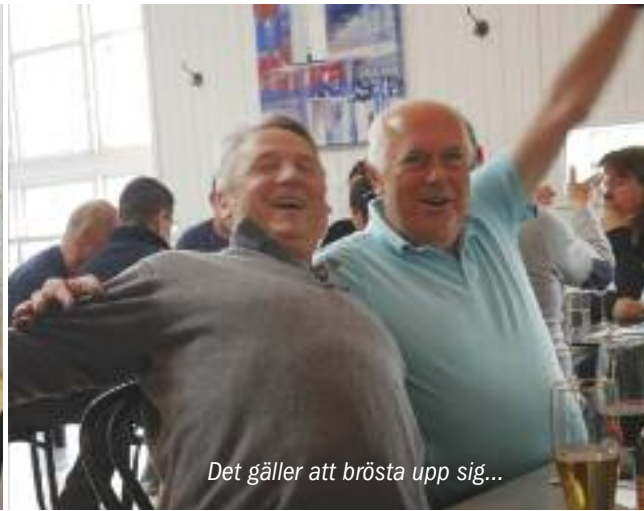
Det gäller att brösta upp sig...