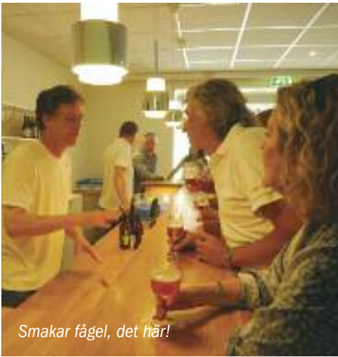
Smakar fågel, det här!