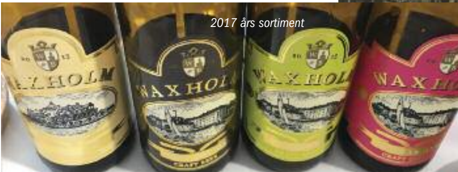
2017 års sortiment