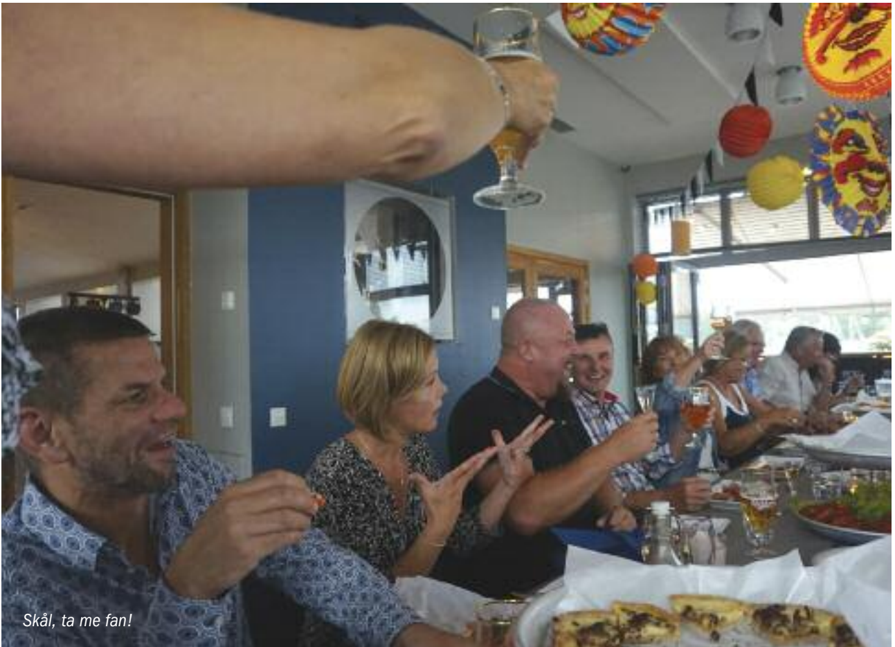
Skål, ta me fan!