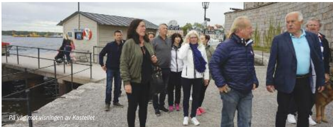
På väg mot visningen av Kastellet

Vi samlades på torsdagen den 25 maj i gästhamnen i Waxholm. Klubbmästeriet hade förbokat platser, tog emot