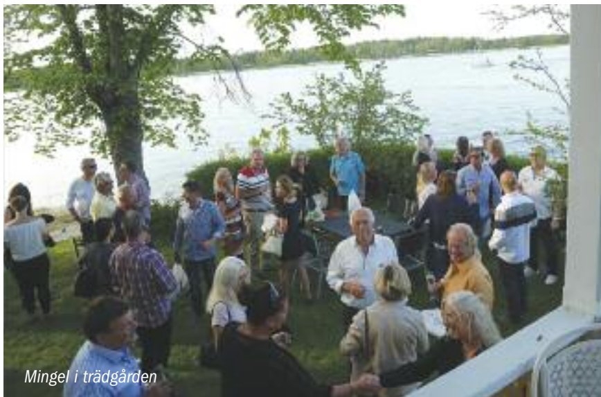
Mingel i trädgården