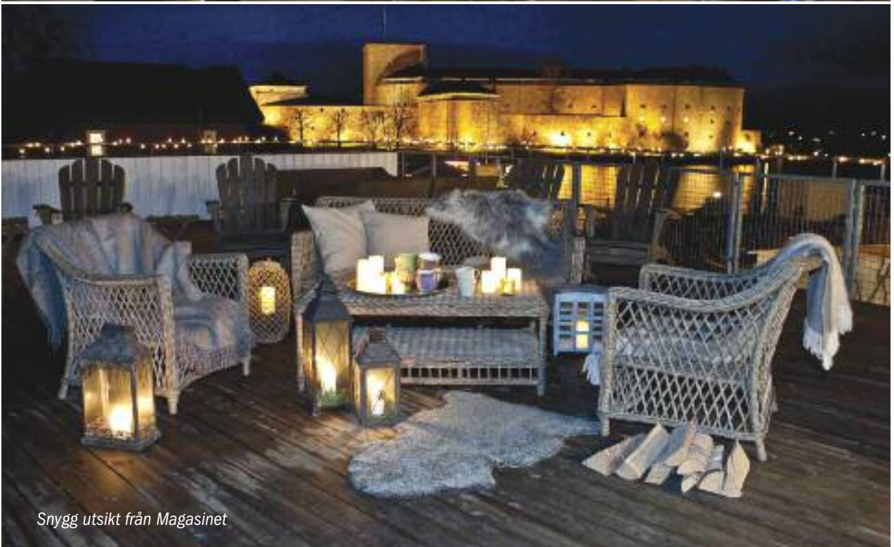
Snygg utsikt från Magasinet