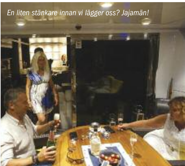
En liten stänkare innan vi lägger oss? Jajamän!