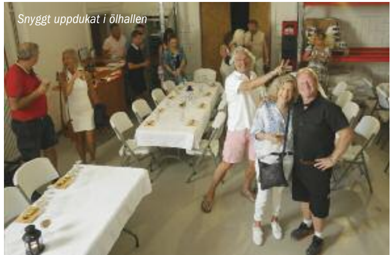
Snyggt uppdukat i ölhallen