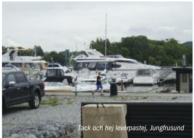
Tack och hej leverpastej, Jungfrusund