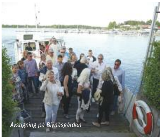
Avstigning på Blynäsgården

Först minglade vi i trädgården denna ljumma, fina försommarkväll, drack lite mer bubbel och sedan tog vi plats i den festligt, festdukade festsalen i Blynäsgården och avnjöt en