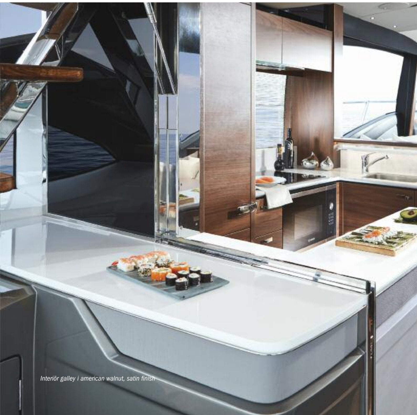
Interiör galley i american walnut, satin finish

Generösa däcktytor ute för avkoppling, inklusive en härlig sitt- och solplats på fördäck, och utrymme för t ex en jolle