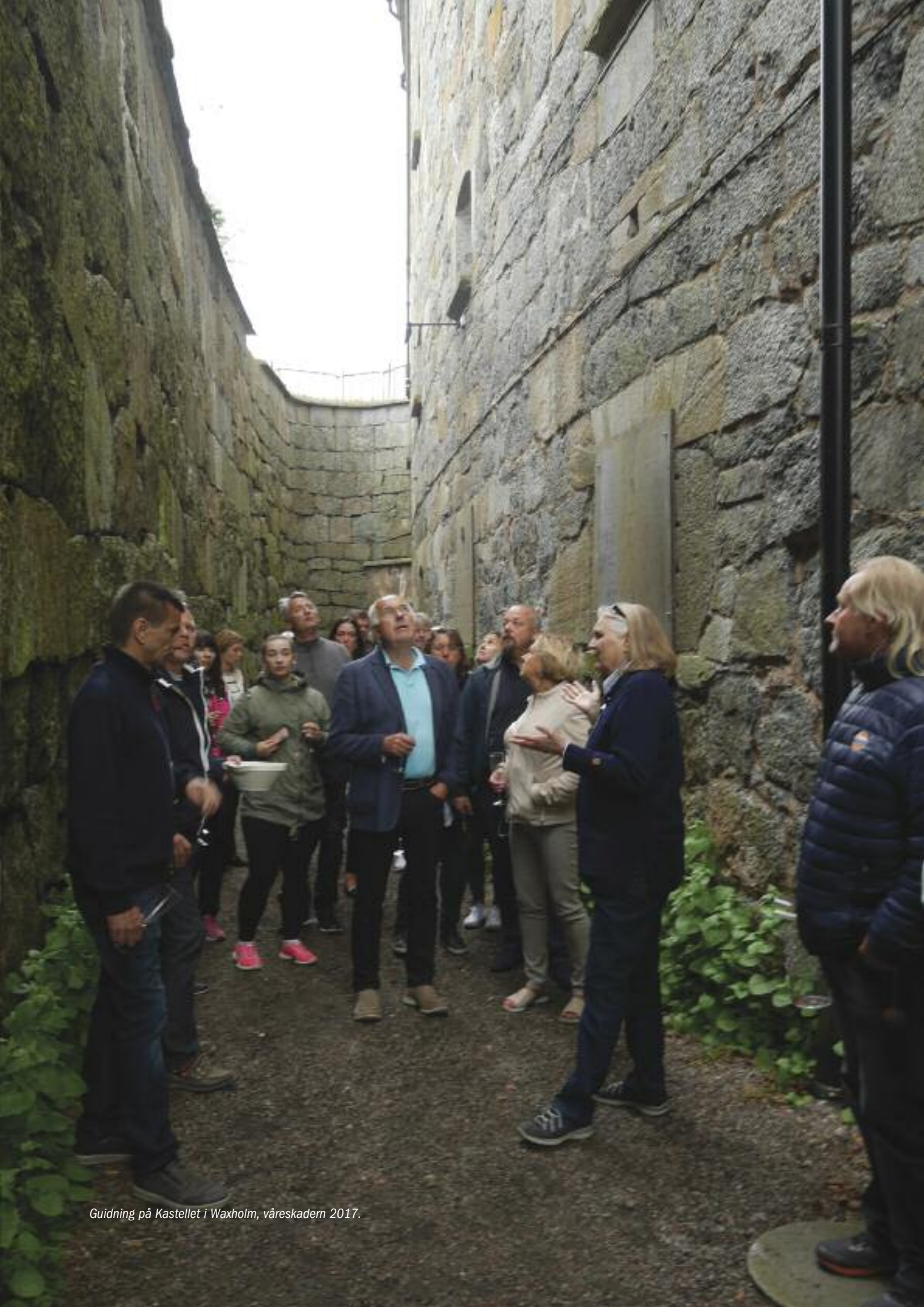
Guidning på Kastellet i Waxholm, våreskadem 2017.