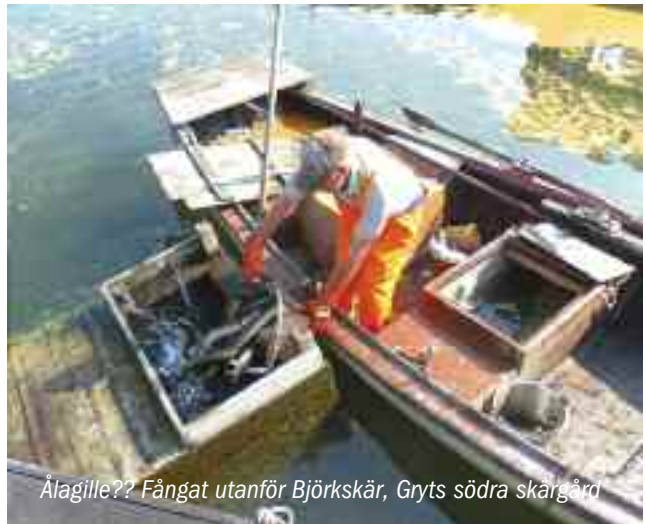
Ålagille?? Fångat utanför Björkskär, Gryts södra skärgård

get och blev förstås ormbiten i nosen och bara la sig ner och ville inte gå längre vilket ju bara är bra.