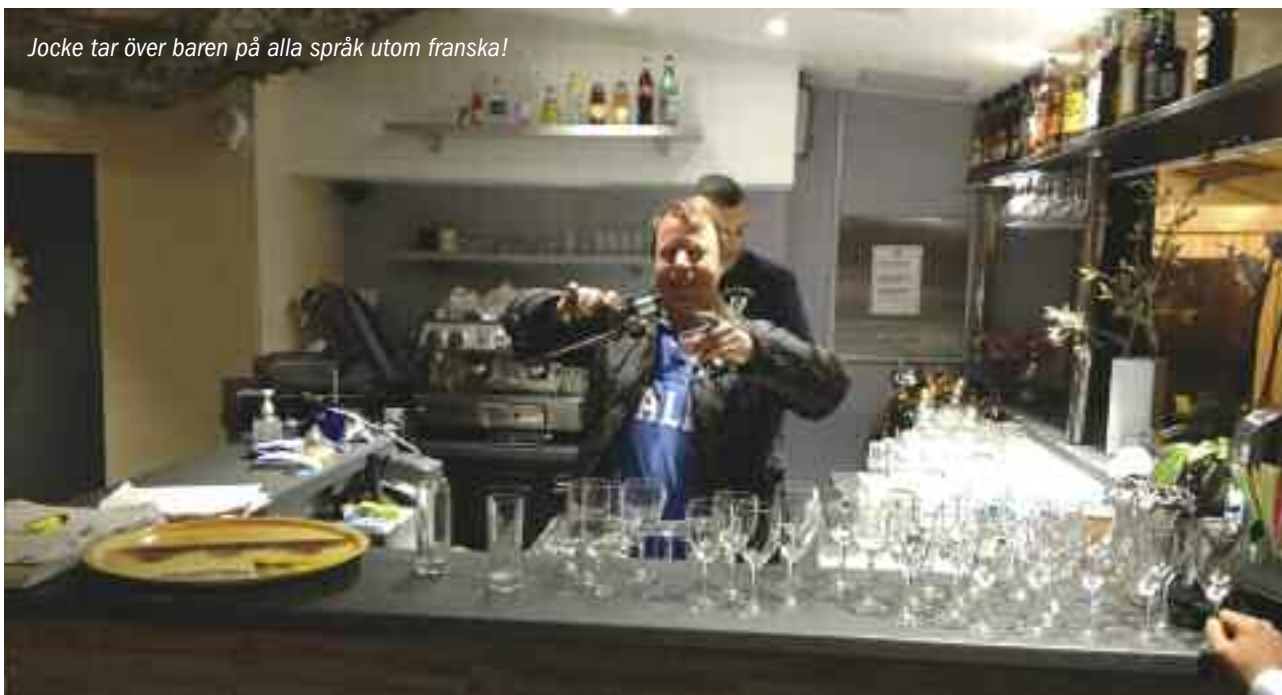
Jocke tar över baren på alla språk utom franska!

under kursen i Fransk diplomati frågade "Are you from England, Sir?".