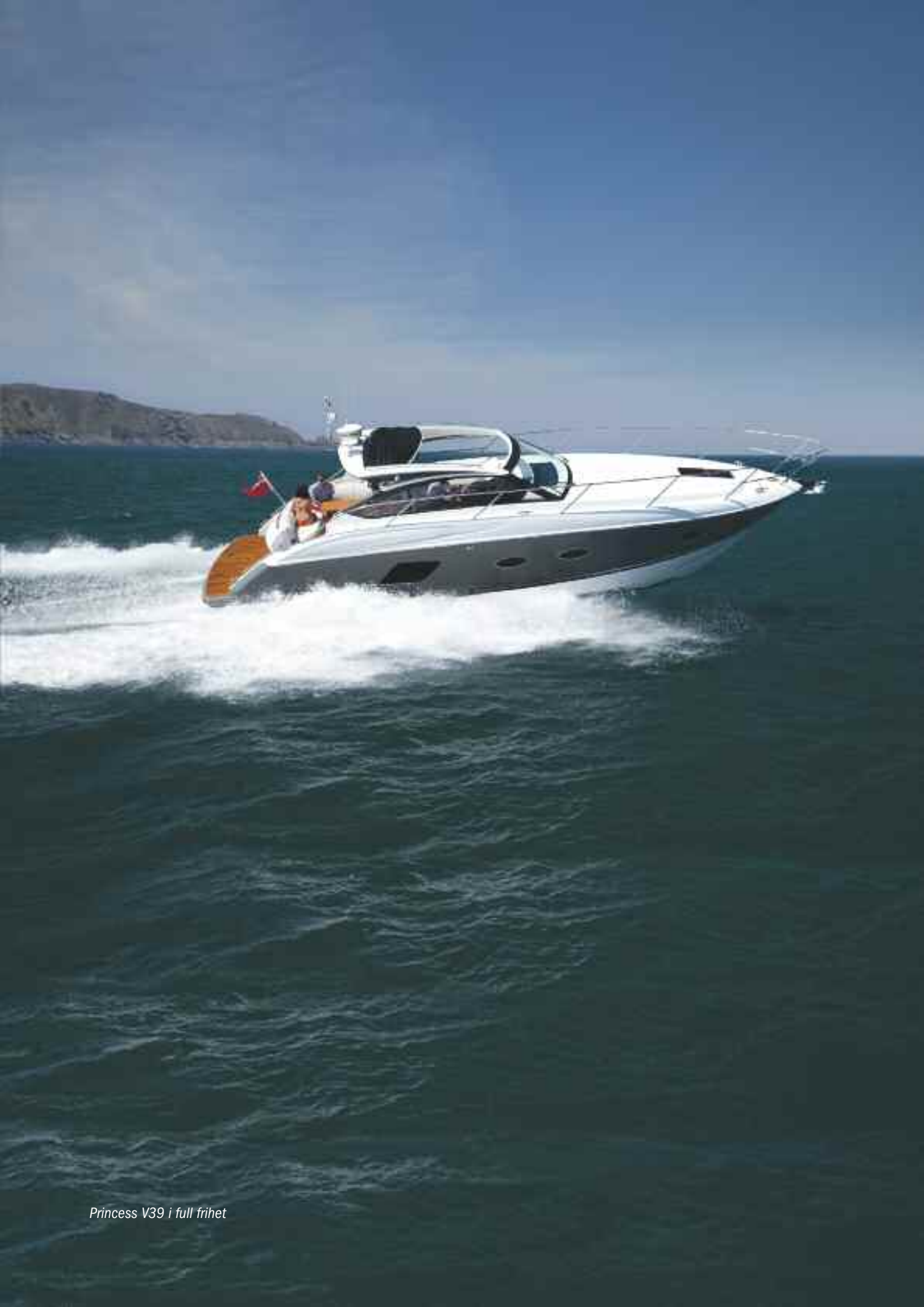
Princess V39 i full frihet