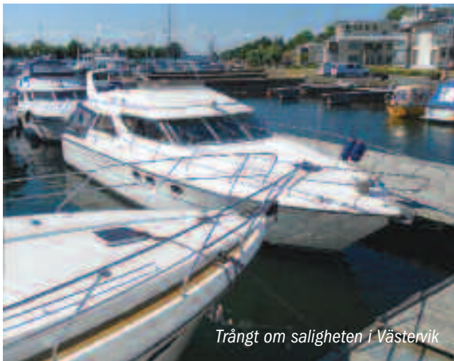
Trångt om saligheten i Västervik

Sällskapets Flatcoat Retriever skulle givetvis fram och sniffa på det mörka spännande som ringlade sig på varma ber-