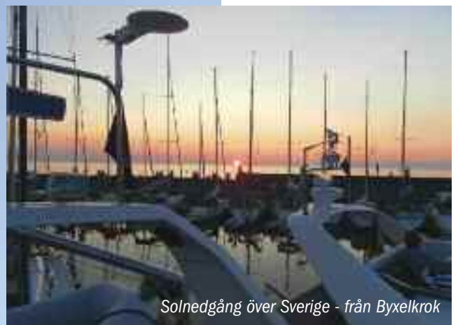
Solnedgång över Sverige - från Byxelkrok