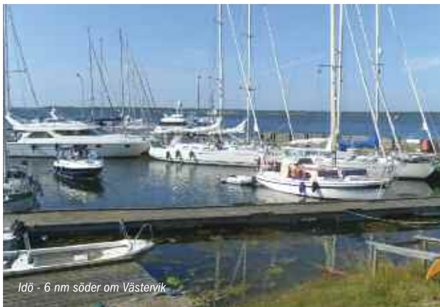
Idö - 6 nm söder om Västervik