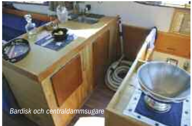
Bardisk och centraldammsugare