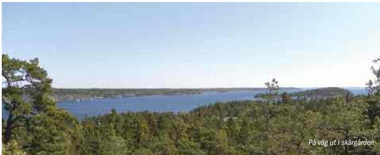
På väg ut i skärgården

Vi hade förstås fuskat och kommit ut och tagit plats redan på onsdagen, dvs långt innan anstormningen på Kristi Himmelfärdsdagen. Vi hann också med ett par rejäla promenader på ön som ska vara känd för sina fantastiska