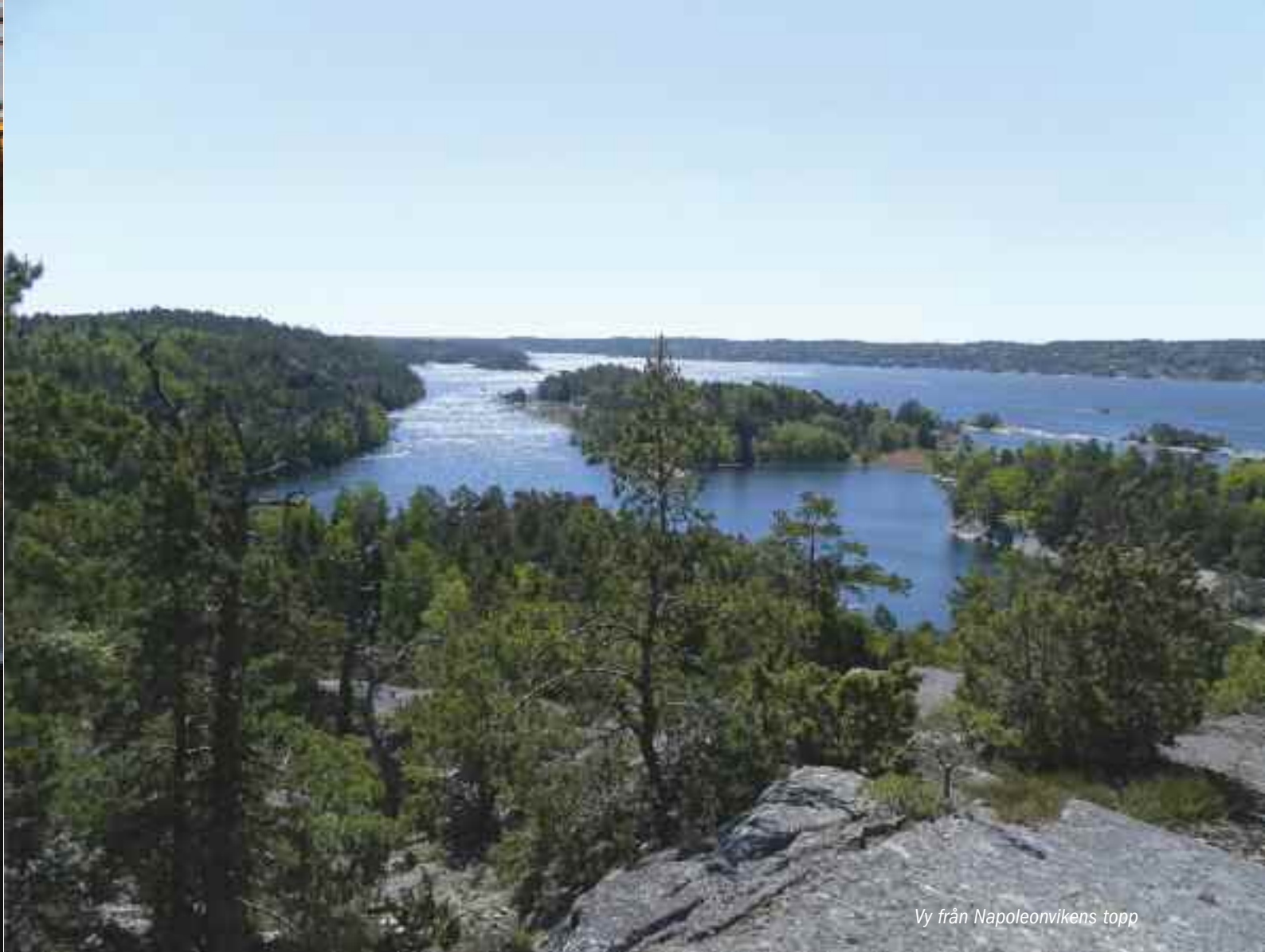
Vy från Napoleonvikens topp

ängar.... av just dessa såg vi inga men en d-a massa berg! Vår anförarens trovärdighet var nu på samma nivå som en eka i marvatten.