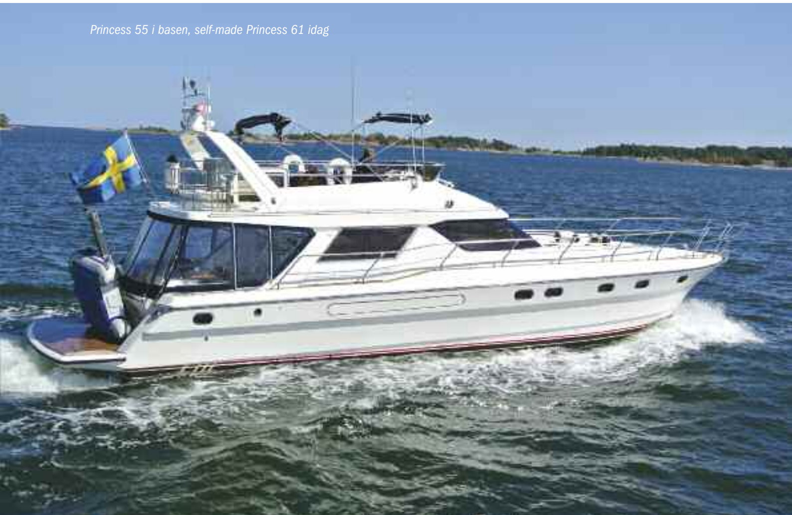
Princess 55 i basen, self-made Princess 61 idag