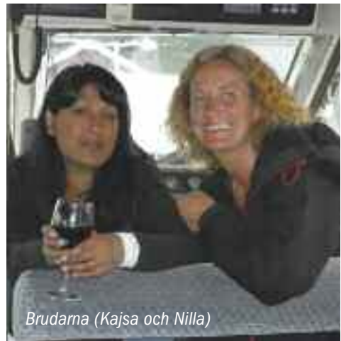
Brudama (Kajsa och Nilla)