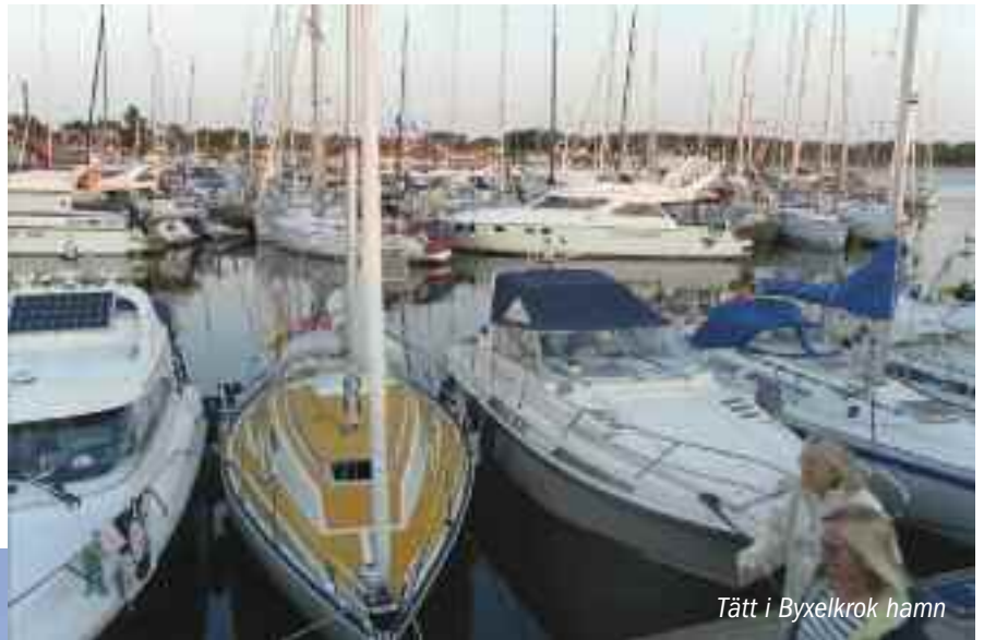
Tätt i Byxelkrok hamn