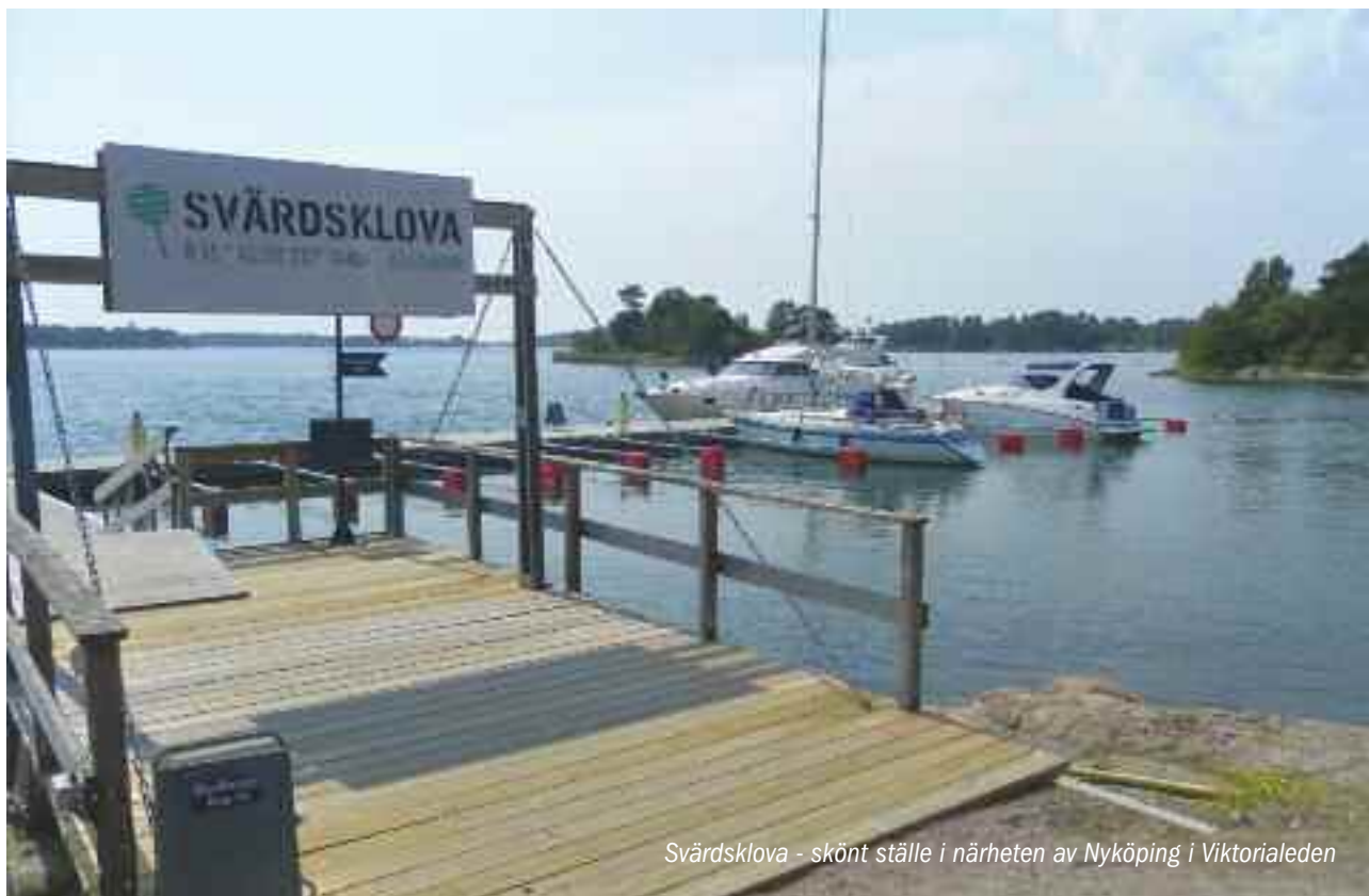
Svärdsklova - skönt ställe i närheten av Nyköping i Viktorialeden