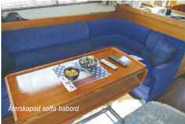
Återskapad soffa babord