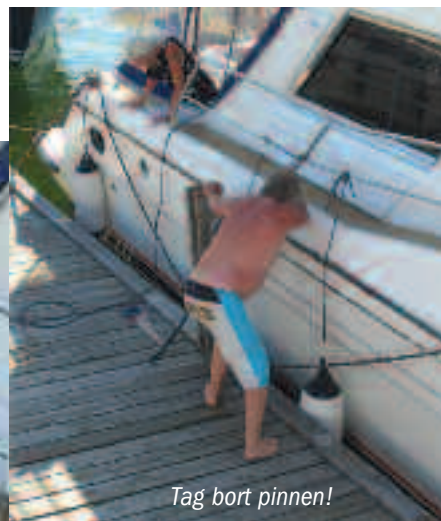
Tag bort pinnen!