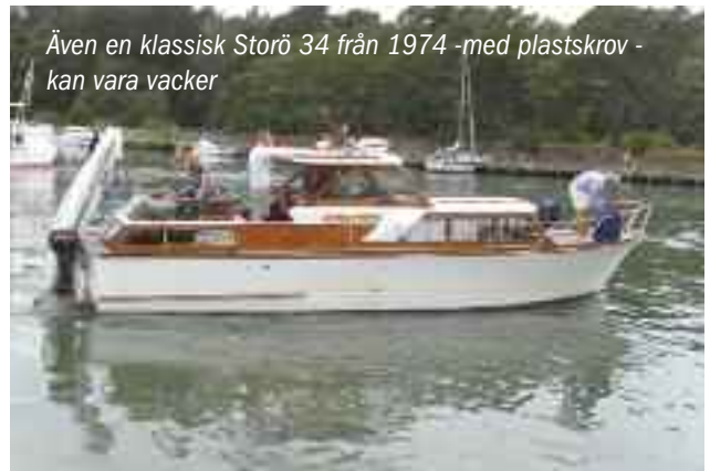
Även en klassisk Storö 34 från 1974 -med plastskrov - kan vara vacker