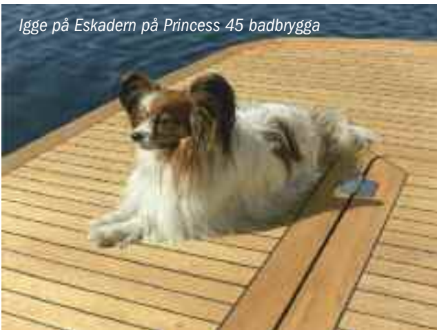
Igge på Eskadern på Princess 45 badbrygga