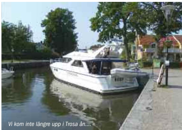
Vi kom inte längre upp i Trosa ån....

Vi gjorde också ett omfattande studiebesök i en 50-fots Grand Banks. De inte bara ser annorlunda ut än Princessorna - de är mycket annorlunda också!