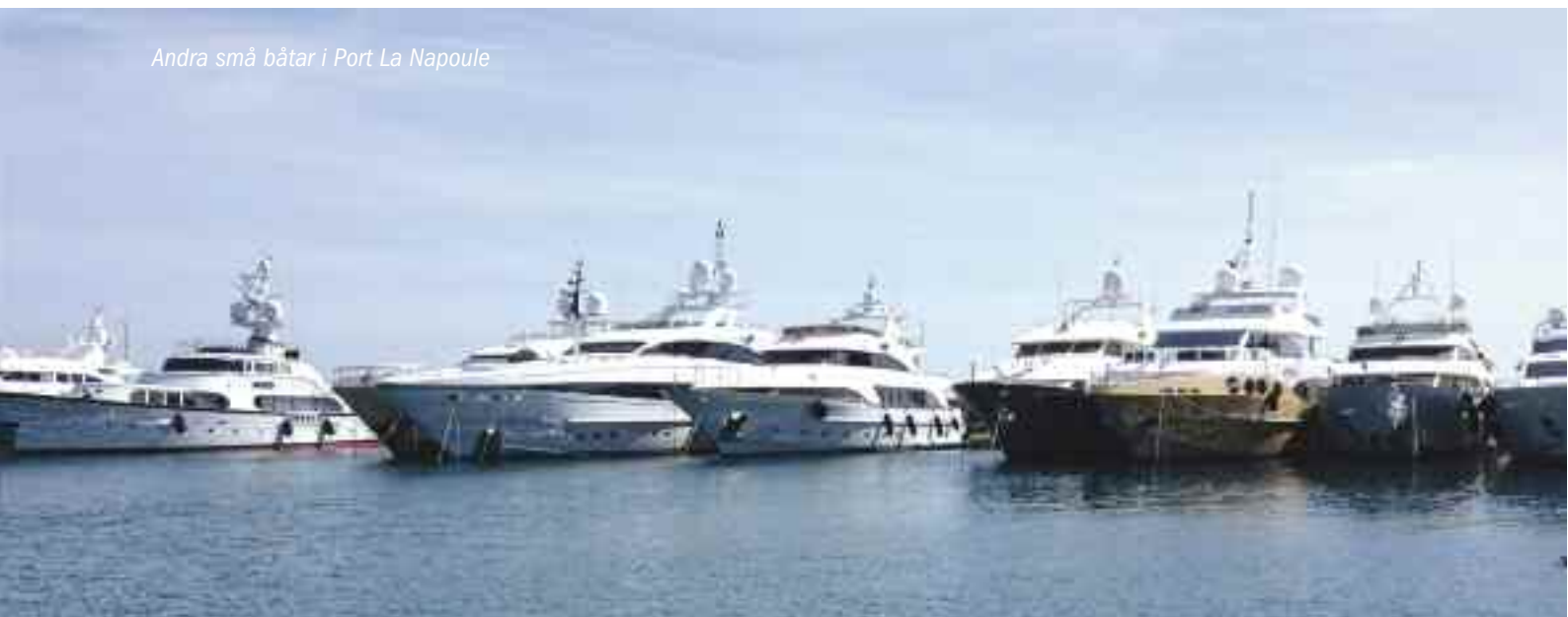
Andra små båtar i Port La Napoule

Men hade vi bara haft varsin basker så hade vi dock lätt kvalat in som äkta fransoser efter den middagen.