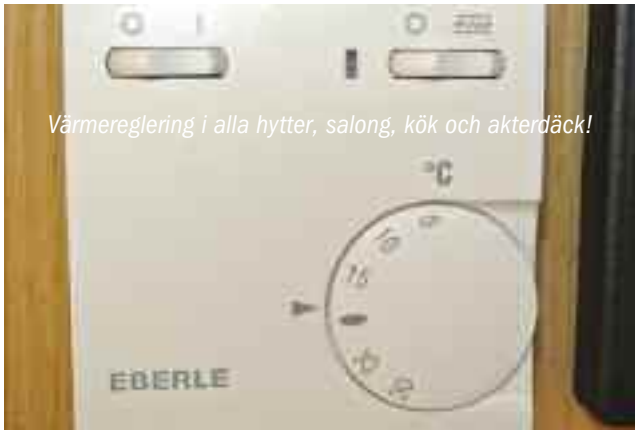
Värmereglering i alla hytter, salong, kök och akterdäck!