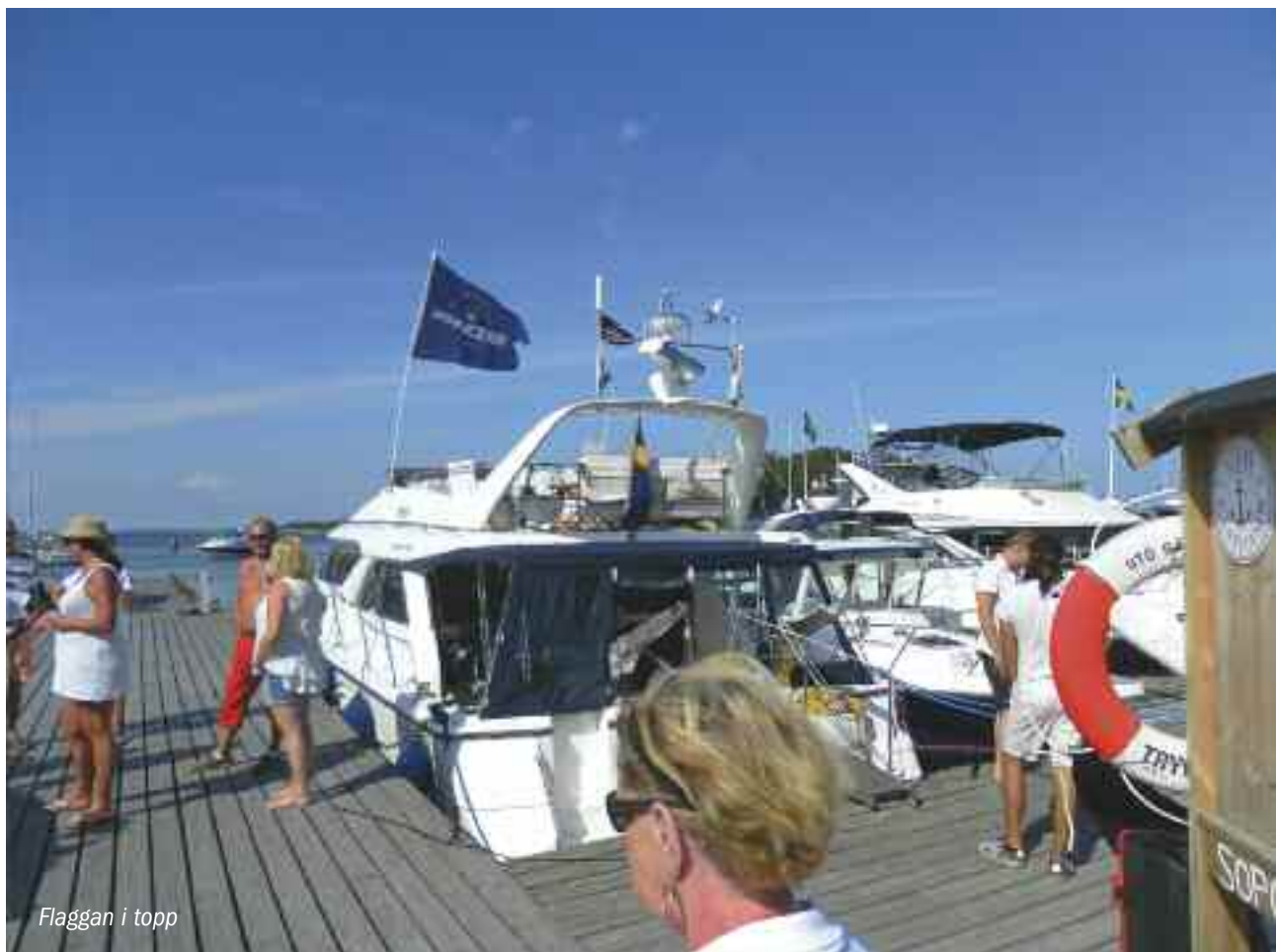
Flaggan i topp