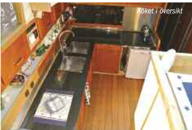
Köket i översikt