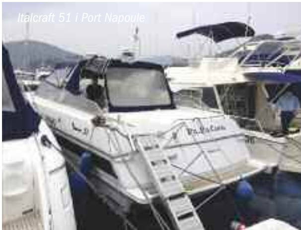
Italcraft 51 i Port Napoule

Först intar vi Café Roma just framför Palais des Festivals på Croisette i Cannes för brunch och därefter bunkring på gatorna bakom torget.