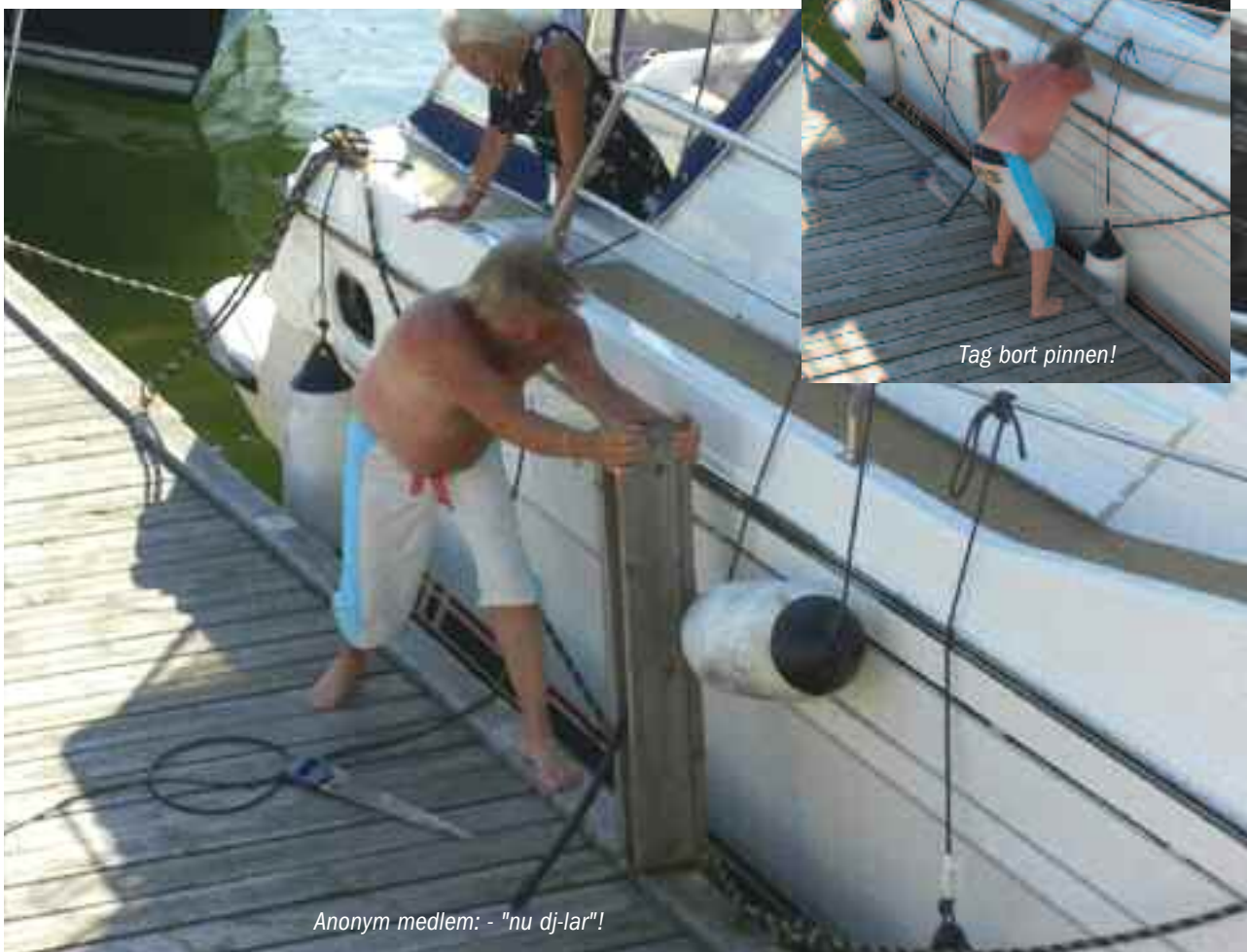
Anonym medlem: - "nu dj-lar"!