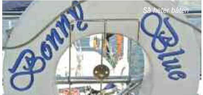
Så heter båten