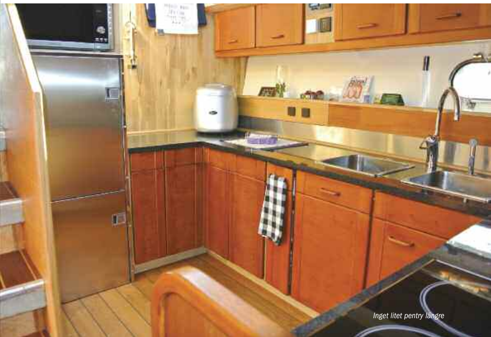
Inget litet pentry längre

knäpptysta toaletter som utan vidare äter en katt utan att knorra, "dubbel" vattenpump som låter dig spola vatten med fullt tryck överallt samtidigt, kapell med såväl myggnät som solskydd förutom "vanliga" rutor, ny framruta, "halvgenomskinligt" rutkapell (som alltid kan sitta på), tyristorstyrd bog och häcksnurra (Sleipner), omklädda soffor i salongen, teakdurk, förlängt tak över doghouse/akterdäck med jätte-fly som resultat (just flybridge är nästa års projekt med planerad wetbar & stekbord), nygjord biminitopp, stor glas-lucka till fly och branta stegen utbytt mot en böjd och bekvämare trappa, inbyggd ventilerad garderob för blöta kläder "innanför trappan" på styrbords sida på akterdäck, "feta" dynor till omgjorda aktersoffan, dörr till badbrygga, förlängt skrov med