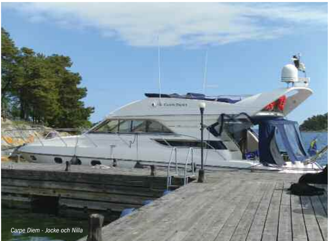
Carpe Diem - Jocke och Nilla

Eskadern var även i år utsatt med korta distanser efter första samling i Napoleonviken. Vi har ju en del år förr kört rätt