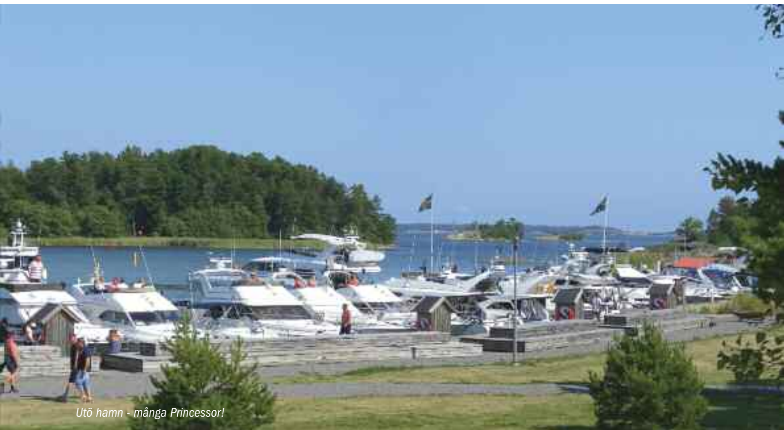
Utö hamn - många Princessor!