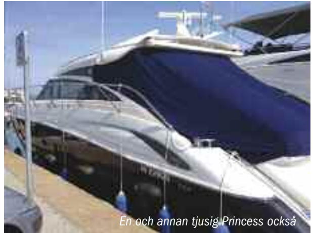
En och annan tjugisig Princess också

Båten, Italcraft 51 med dubbla Detroit dieslar, ligger strax väster om Cannes i Port La Napoule och vi ordnar transport i stort sett fram till akterdäck! Vi gör oss hemmastadda i