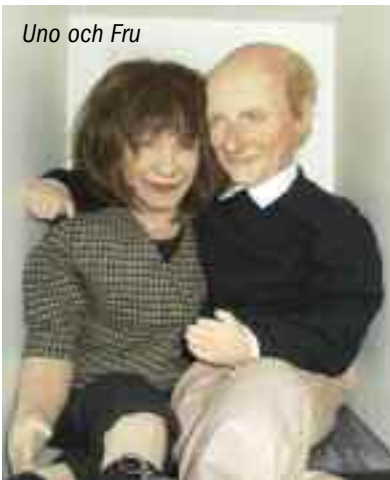
Uno och Fru