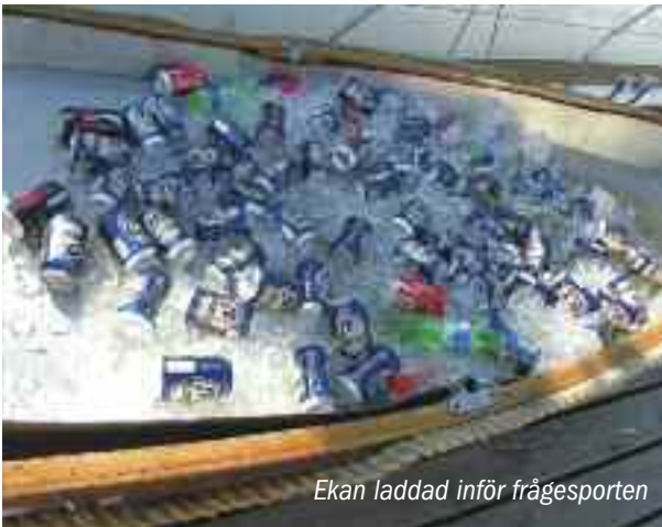
Ekan laddad inför frågesporten

de svenska kräftorna med tillbehör dukades upp medan vi beställde i baren.