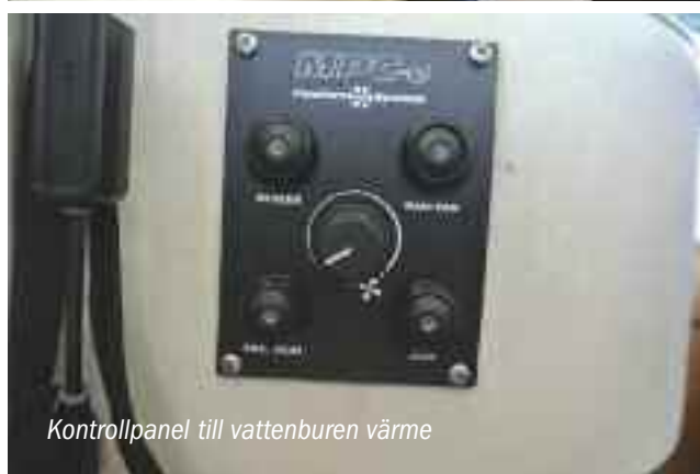
Kontrollpanel till vattenburen värme