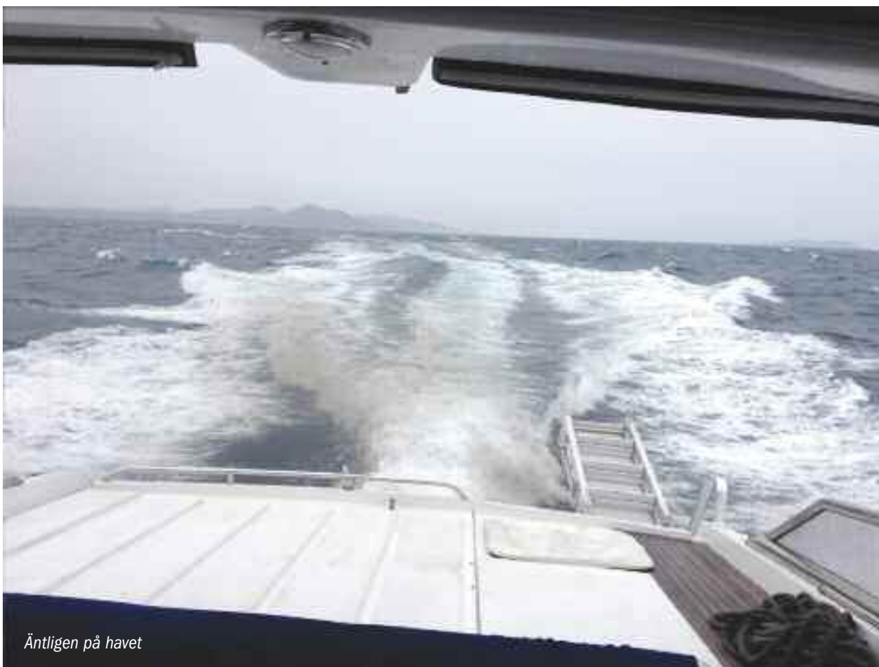
Äntligen på havet

Detta uppskattades dock inte helt av vår segelbåtsgranne som klagade högljutt, varvid Jocke som hade håltimme