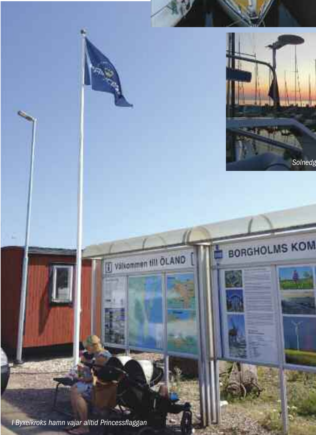
I Byxelkroks hamn vajar alltid Princessflaggan