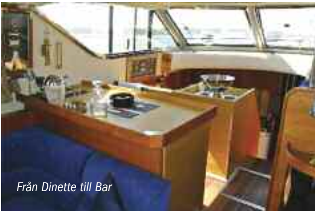
Från Dinette till Bar

badbryggan, 4-sektioners hydraulisk landgång i stället för däckertarna, och nya träjalusier i salongen för solen. Till detta förstås det vi alla med 20+ år gamla båtar behövt byta över