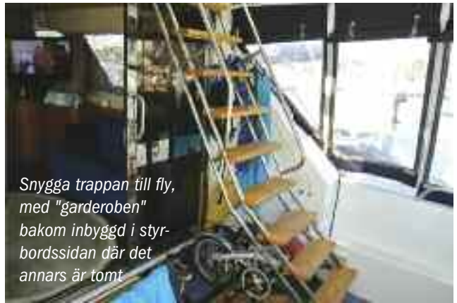
Snygga trappan till fly, med "garderober" bakom inbyggd i styrbordssidan där det annars är tomt