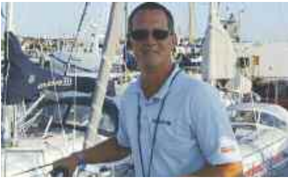
Hamnkaptenen med Svart Bälte i båtpackning (cirka 140 båtar på 74 platser....)