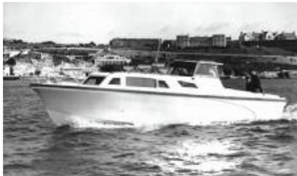
Project 31, redan 1965.

En imponerande utveckling som startade med 31-fots båten