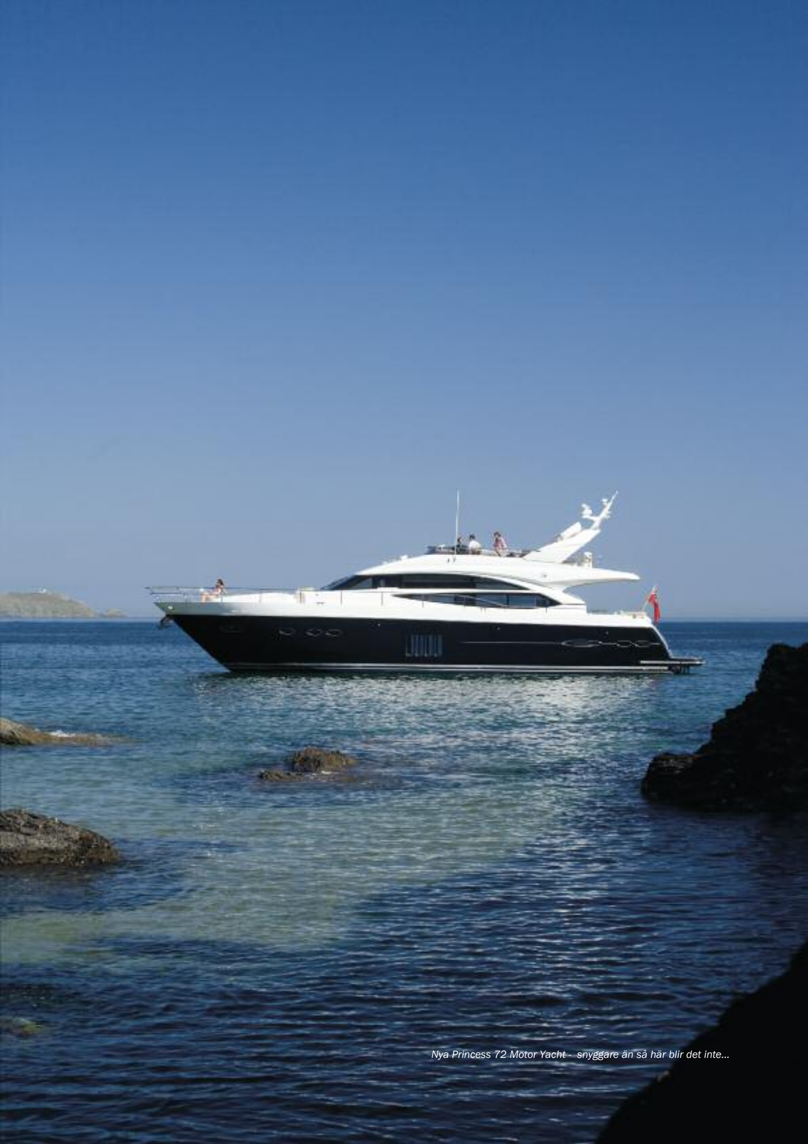
Nya Princess 72 Motor Yacht - snyggare än så här blir det inte...