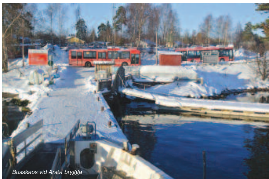
Busskaos vid Årsta brygga

På lördagen åkte vi kommunalt till Årsta Havsbad eftersom vi inte skulle komma tillbaka dit dagen efter. Bussen släppte av oss vid "stora vägen" och körde inte ner till bryggan för att tre (!) SL-bussar hade kört fast i snön nere vid bryggan vilket också stoppade varutransporter ut till ön i flera dagar.