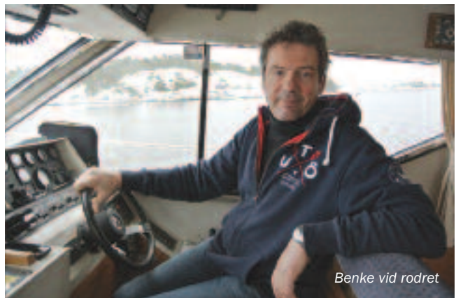
Benke vid rodet