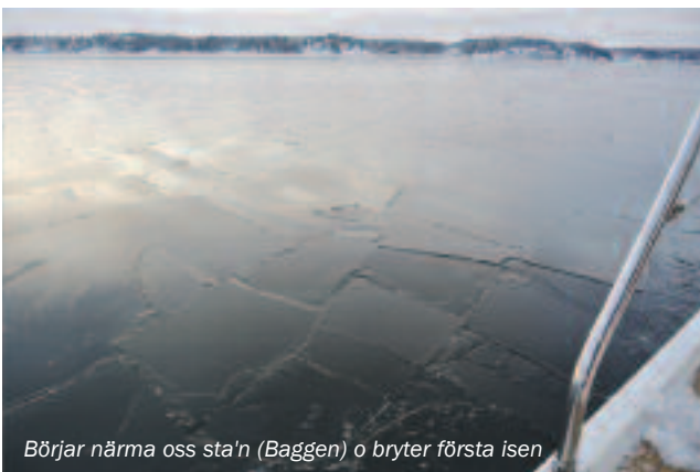
Börjar närma oss sta'n (Baggen) o bryter första isen

Enda egentliga störningen så långt, var ett större antal MMS från Benkes polare kring Baggen med bilder på termometrar som visade minus 15 och SMS med enkla budskap