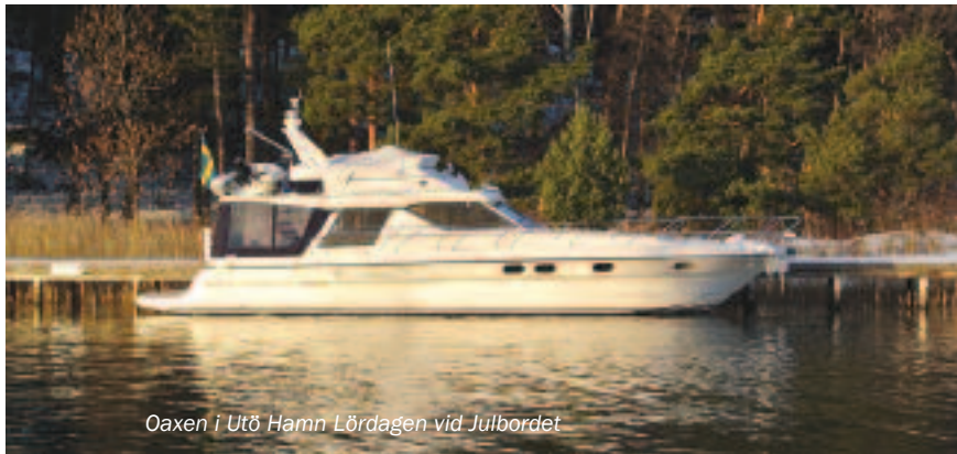
Oaxen i Utö Hamn Lördagen vid Julbordet