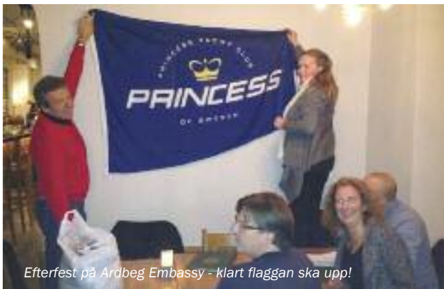
Efterfest på Ardbeg Embassy - klart flaggan ska upp!

i Gamla Stan har upplevt. Vi lärde oss tex. vilka bordeller som låg var och fick en speciell genomgång om vad cafét i Tyska Kyrkan tidigare användes till och varför lukten var svår att få ur väggarna vid renoveringen. Jag fikar därför kanske inte just där i framtiden.