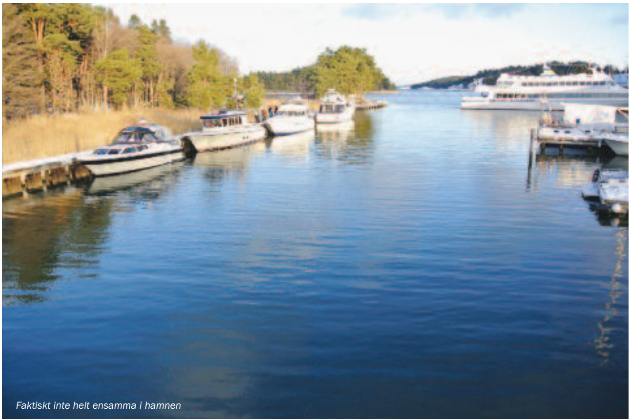
Faktiskt inte helt ensamma i hamnen